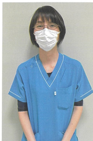
臨床工学技師:ライトブルー